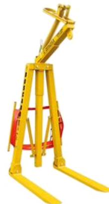
Volantino di bloccaggio